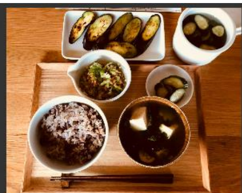
朝食 こだわりの石川村産の米・新鮮な野菜・水・お茶