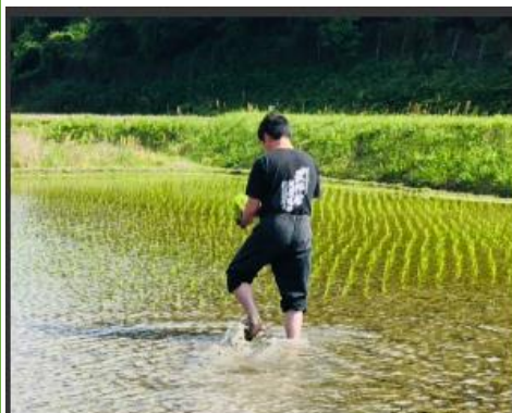
農業を通じて忍者の基本的動きを習得！